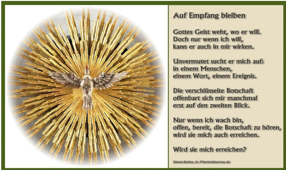
Bild: Martin Manigatterer (Bildkomposition), Gisela Baltes (Text)